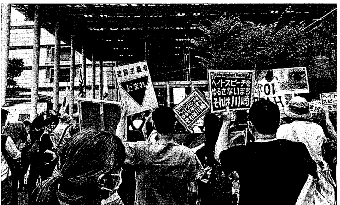
ヘイト集団にたいしプラカードをかけた抗議する市民 (9月20日、神奈川県川崎市)

2019年12月12日、川崎市議会で、出席議員の賛成で成立した「川崎市差別根絶条例」(以下「差別根絶条例」)が、昨年1月、本紙に「川崎市で差別根絶条例」をめぐって市民が勝ち取った!差別に初めて刑事規制」と題して私の投稿を掲載していただいた。 川崎市のこの条例については、各新聞やN