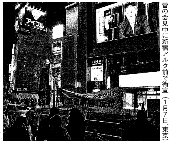
菅の会見中に新宿アルタ前で街宣(1月7日、東京)

1月1日、大阪府警本部前で全日建連労組関西地区生コン支部(以下、関生支部)への弾圧を許さない行動がおこなわれ、400人が集まった。熱のこもった発言やシュプレヒコール、歌などで参加者の思いはどんどん強くなっていった。 冒頭、司会から「国家権力による不当判決がいくつも出され、労働運動そのものを否定し、私たちが声を上げる権利そのものが奪われていくような弾圧が