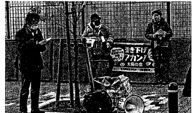
1月7日、大阪地裁前でピラミキをする「引き下げアカン！大阪の会」の仲間

生活保護の発展は「健康 で文化的な生活」を前提 とする。最低限度の生活 とは、最低限度の生活