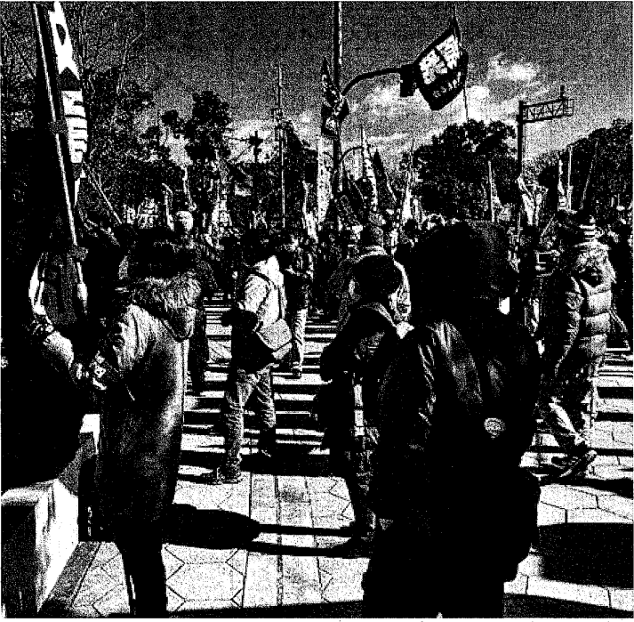
大阪府警本部をとり囲み、400人が力強くシュプレヒコール(1月1日)

1月1日、大阪府警本部前で全日建連労組関西地区生コン支部(以下、関生支部)への弾圧を許さない行動がおこなわれ、400人が集まった。熱のこもった発言やシュプレヒコール、歌などで参加者の思いはどんどん強くなっていった。 冒頭、司会から「国家権力による不当判決がいくつも出され、労働運動そのものを否定し、私たちが声を上げる権利そのものが奪われていくような弾圧が