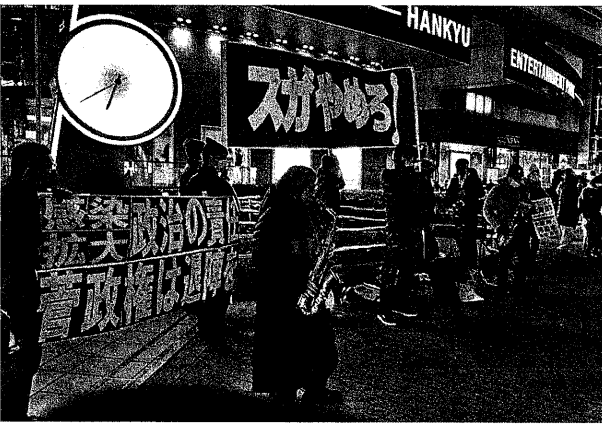
「スガやめろ!」の横断幕をひろげ、街行く人にアピールする梅田解放区の参加者(1月9日、大阪)

菅首相は、自著『政治家の覚悟』で、「アベノミクスを継承し、集中的に改革し、必要な投資を行い、再び強い成長を実現した」と述べている。コロナ拡大を抑えこんでくることができない中で、「新自由主義」と「治安強化」を掲げ、菅首相は、自著『政治家の覚悟』で、「アベノミクスを継承し、集中的に改革し、必要な投資を行い、再び強い成長を実現した」と述べている。