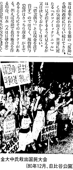
金大中氏救出国民大会 (80年12月、日比谷公園)

在日韓国人「政治犯」救援 全関西総決起集会。中ノ島中央公会堂大ホール PM:6:00