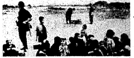
ベトナム反戦運動の参加者

ベトナム反戦運動の参加者 ラッセル国際戦犯法廷の意義 鶴 嶋 雪 嶺 欧米のベトナム反戦運動は、単なる反戦運動ではなく、人間の存在の根柢を揺るがすことによって、人間の存在の根柢を再考させるものなのだ。それは、人間の存在そのものを否定するものではない。むしろ、人間の存在の根柢を揺るがすことによって、人間の存在の根柢を再考させるものなのだ。