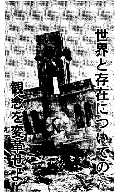
世界と存在についての観念を革新せよ

「黒い雨」ヒロシマ・ノート「地の群れ」に 触発される核爆発の想念 川 桐 信 彦 非論的、非倫理的に描かれた「黒い雨」の核爆発の惨状は、人間の存在の根柢を揺るがす。それは、人間の存在そのものを否定するものではない。むしろ、人間の存在の根柢を揺るがすことによって、人間の存在の根柢を再考させるものなのだ。 「黒い雨」は、核爆発の惨状を描くだけでなく、人間の存在の根柢を揺るがすことによって、人間の存在の根柢を再考させるものなのだ。それは、人間の存在そのものを否定するものではない。むしろ、人間の存在の根柢を揺るがすことによって、人間の存在の根柢を再考させるものなのだ。