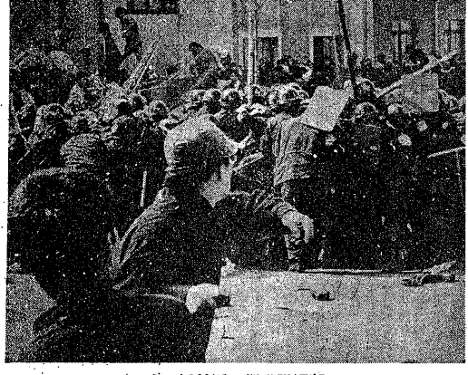
穴守橋付近で機動隊退却

【東京14日電】羽田空港で、全学連、全学連連帯、全国反戦連帯の三団体が、佐藤政権のベトナム反革命戦争介入に巨大な一撃を与え、世界を揺がせた。同日、羽田空港で、全学連、全学連連帯、全国反戦連帯の三団体が、佐藤政権のベトナム反革命戦争介入に巨大な一撃を与え、世界を揺がせた。