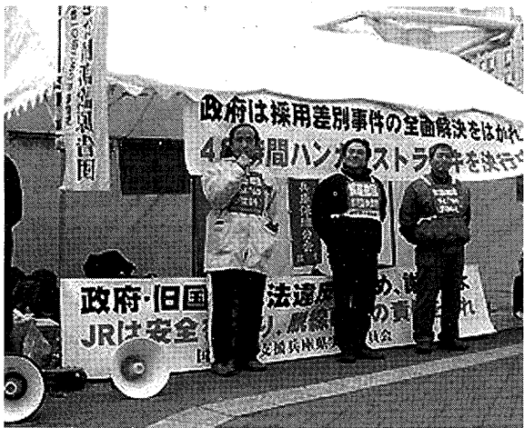
神戸駅前でハスト中の闘う闘争団 (2月14日)