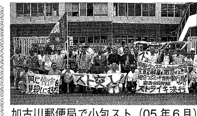
加古川郵便局で小包スト (05年6月)