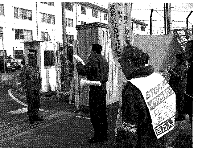
自衛隊伊丹基地に申し入れ(2月22日)

しかも、「あたご」は、昨年11月から今年1月下旬まで、ハワイ沖で対空ミサイル発射訓練をおこなった。そこから「あたご」は、僚船の帰還途中だった。「あたご」は、まさに軍事行動を継続中だった。だから、「船舶銀座」といわれる海域に近づき、漁船団を感知していたにもかかわらず、自動操舵のまま10ノット(時速18キロ)で直進をつづけた。「清徳丸」の僚船の船長によれば、「私の表(前方)をあけるという風に走っていた」という。規定で5回発すべき汽笛も船長たちはきいていない。7700トンの「あたご」はまったく回避行動をとらなかった。ほとんど直角に衝突された7.3トンの「清徳丸」の船体は、真つ二つにひきさかれた。