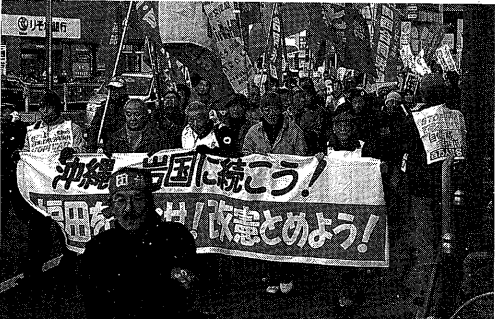
2月10日天六から梅田へデモ

りして、世界中でいま、困難なたたかいをつづけている人びとと連帯するたたかいであり、われわれにとって世界を変えるたたかいであります。言葉でプロレタリア人民と連帯するなんていったってダメだよ。このことを肝に銘じて諸般の困難をのりこえてきたかっぺいきたい」と信念に満ちた決意がこたえられた。 つづいて、連帯ユニオン関西地区生コン支部、関西合同労働組合、高槻医療福祉労働組合、三里塚決戦勝利関西