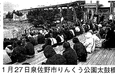
1月27日泉佐野市りんくう公園太鼓橋

りして、世界中でいま、困難なたたかいをつづけている人びとと連帯するたたかいであり、われわれにとって世界を変えるたたかいであります。言葉でプロレタリア人民と連帯するなんていったってダメだよ。このことを肝に銘じて諸般の困難をのりこえてきたかっぺいきたい」と信念に満ちた決意がこたえられた。 つづいて、連帯ユニオン関西地区生コン支部、関西合同労働組合、高槻医療福祉労働組合、三里塚決戦勝利関西