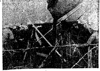
11日、朝七時半の中での集まり

東京反戦代表派遣団の東京支部は、十一月八日、三里塚の抑圧された土地に、労働者、農民、学生、市民の連帯した大規模なデモ隊を率い、工事阻止の目的を達成し、勝利の展望を切り拓いた。 この日、東京反戦代表派遣団の東京支部は、三里塚の抑圧された土地に、労働者、農民、学生、市民の連帯した大規模なデモ隊を率い、工事阻止の目的を達成し、勝利の展望を切り拓いた。 この日、東京反戦代表派遣団の東京支部は、三里塚の抑圧された土地に、労働者、農民、学生、市民の連帯した大規模なデモ隊を率い、工事阻止の目的を達成し、勝利の展望を切り拓いた。