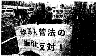
▲TRYの入管法施行反対デモ(1面)