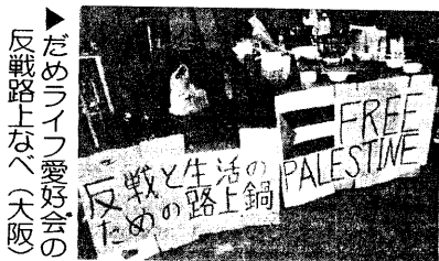
だめライフ愛好会の反戦路上なべ(大阪)