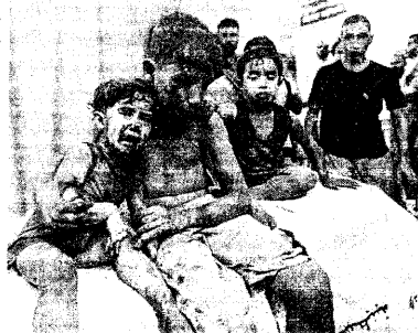
▶ガザ南部ハイン・ユニアスのナセル病院で治療を受ける子どもたち(10月24日)

972とローカル・コイル」が、イスラエルの爆メカニズムについて調査を公表した(注)。ここで軍関係者へのインタビューなどから、AIがジエノサイドに果たしている深刻な問題が具体的に指摘された。