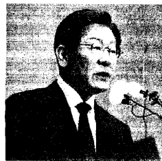
李在明・民主党代表

ないだろうか。これらは、努力すれば実現可能な短期目標だ。孤立感を感じない市民運動を作り、日本でも5%の「目覚めた市民層」を作り出そう!