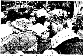
▲イスラエル大使館前行動(東京)

私は関東で「反管理」「反戦平和」「雇用と生活の保障」などを目指し、高校時代から10年以上社会運動と生活を共にしてきた。今では多くの仲間も友人もでき、成果と呼べるも