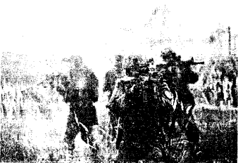
ウクライナに配備されているSAS特殊部隊

「ポーランド特殊部隊は本国へ戻らずに、反対方向へ、つまり、ロシア人やユダヤ人が多い分離主義者を弾圧するために」