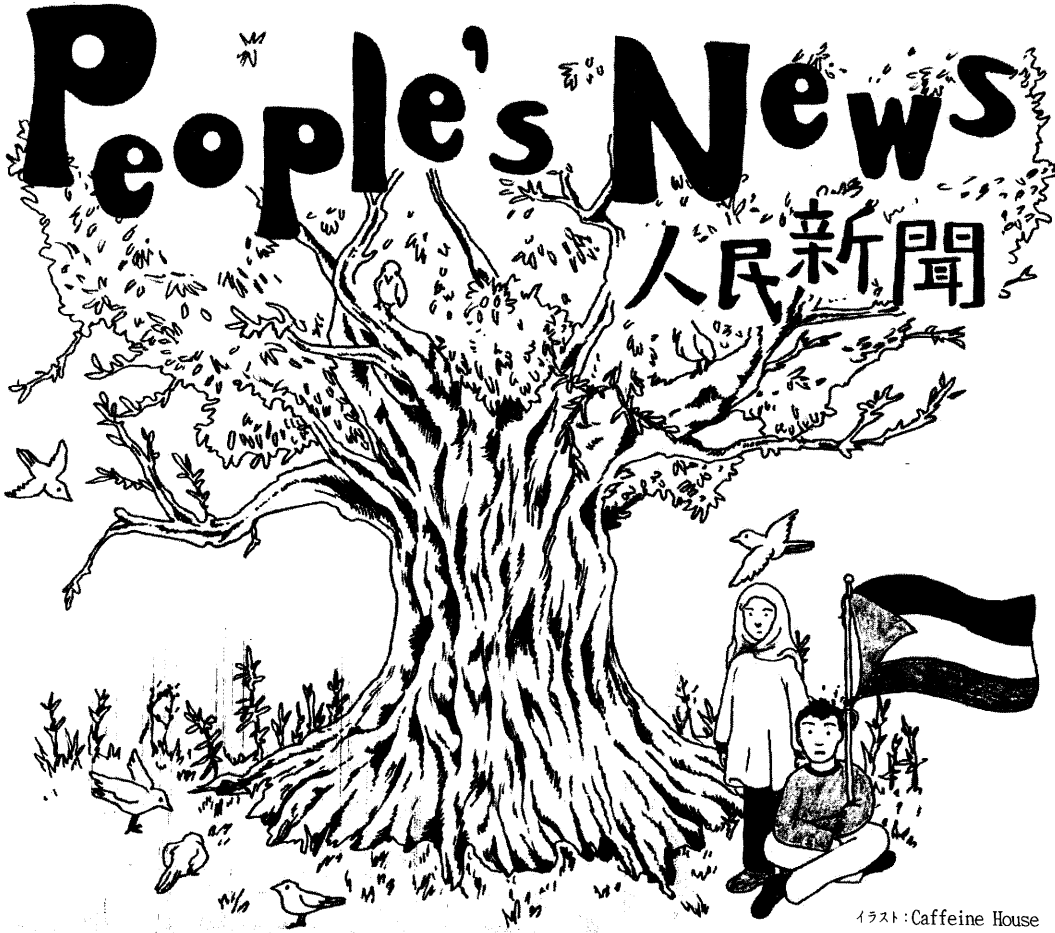
イラスト: Caffeine House

沸騰する世界 パレスチナ連帯する南ア青年 フェミニストの国際的抗議 韓国: 言論弾圧との闘い 福島: 汚染水阻止テント開始