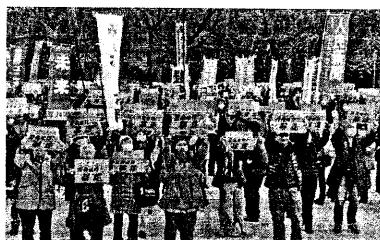
12・3 うつぼ公園にて

・379号(12月7日付) 他 11・23 沖縄平和大集会 他 ・パレスチナ連帯・ガザ反戦闘争 鳥居論文・重信房子さん発言