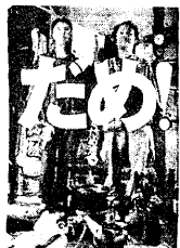
▲かつての「だめ連」が出した本

こう考えると、国家権力やグローバル資本といった抑圧者と闘う姿勢をもつことも、まず自分たちの暮らしを守るため何もせず寝そべることも、どちらも両義的に「だめライフ」であると言える。我々はただ「だめ」がだめでいられる場所」にいたいだけにもかかわらず、大きな反発や弾圧を招いて