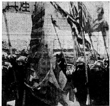
■2・20首都反革命の尖兵練馬第一師団前へ敵兵隊演習。演習は、戒厳令体制をつきくすず。

首都反革命の尖兵として、練馬第一師団が、戒厳令体制をつきくすず、反帝戦線に挑む。練馬第一師団は、首都圏の防衛を担う重要な部隊であり、その動向は、日本の安全保障に重大な影響を及ぼす。この演習は、戒厳令体制の維持と、反帝戦線への対応能力を示すものである。 練馬第一師団は、首都圏の防衛を担う重要な部隊であり、その動向は、日本の安全保障に重大な影響を及ぼす。この演習は、戒厳令体制の維持と、反帝戦線への対応能力を示すものである。