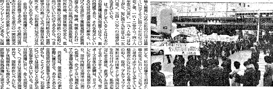
3・20インフレ第一波闘争