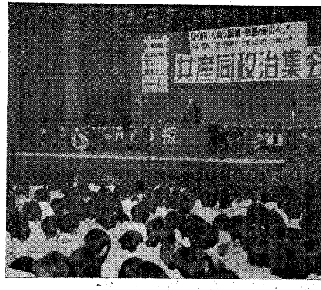
6.3 共産同政治集会(集馬公全)

【東京20日電】共産主義青年同盟(共青同盟)は、6月3日(日)に東京市立大ホールで「6.3共産同政治集会」を開催し、1500名が結集した。この集会は、共青同盟の綱領-戦略の創出を目的として開催された。集会は、共青同盟の綱領-戦略の創出を目的として開催された。集会は、共青同盟の綱領-戦略の創出を目的として開催された。 共青同盟は、6月3日(日)に東京市立大ホールで「6.3共産同政治集会」を開催し、1500名が結集した。この集会は、共青同盟の綱領-戦略の創出を目的として開催された。集会は、共青同盟の綱領-戦略の創出を目的として開催された。集会は、共青同盟の綱領-戦略の創出を目的として開催された。 共青同盟は、6月3日(日)に東京市立大ホールで「6.3共産同政治集会」を開催し、1500名が結集した。この集会は、共青同盟の綱領-戦略の創出を目的として開催された。集会は、共青同盟の綱領-戦略の創出を目的として開催された。集会は、共青同盟の綱領-戦略の創出を目的として開催された。 共青同盟は、6月3日(日)に東京市立大ホールで「6.3共産同政治集会」を開催し、1500名が結集した。この集会は、共青同盟の綱領-戦略の創出を目的として開催された。集会は、共青同盟の綱領-戦略の創出を目的として開催された。集会は、共青同盟の綱領-戦略の創出を目的として開催された。