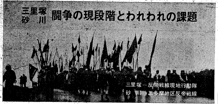
三里塚一反帝戦線地行動隊 砂川三多摩地区反帝戦線

砂川暫壕強化し基地撤去へ！ 三多摩地区反帝戦線 【東京20日電】三里塚一反帝戦線地行動隊は、砂川暫壕を強化し、基地撤去を目的として、三多摩地区反帝戦線を展開している。この戦線は、三里塚一反帝戦線地行動隊と、三多摩地区反帝戦線とが連携して活動している。戦線は、三里塚一反帝戦線地行動隊の中心となり、三多摩地区反帝戦線の中心として活動している。戦線は、三里塚一反帝戦線地行動隊の中心となり、三多摩地区反帝戦線の中心として活動している。戦線は、三里塚一反帝戦線地行動隊の中心となり、三多摩地区反帝戦線の中心として活動している。 三里塚一反帝戦線地行動隊は、砂川暫壕を強化し、基地撤去を目的として、三多摩地区反帝戦線を展開している。この戦線は、三里塚一反帝戦線地行動隊と、三多摩地区反帝戦線とが連携して活動している。戦線は、三里塚一反帝戦線地行動隊の中心となり、三多摩地区反帝戦線の中心として活動している。戦線は、三里塚一反帝戦線地行動隊の中心となり、三多摩地区反帝戦線の中心として活動している。 三里塚一反帝戦線地行動隊は、砂川暫壕を強化し、基地撤去を目的として、三多摩地区反帝戦線を展開している。この戦線は、三里塚一反帝戦線地行動隊と、三多摩地区反帝戦線とが連携して活動している。戦線は、三里塚一反帝戦線地行動隊の中心となり、三多摩地区反帝戦線の中心として活動している。戦線は、三里塚一反帝戦線地行動隊の中心となり、三多摩地区反帝戦線の中心として活動している。