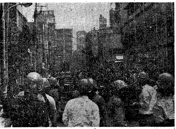
6・15 中部地区反帝戦線を先頭に学館前バリケードで激闘と対峙

【東京20日電】八派全共闘の全国反戦の解体を組織運動構造から止揚再編せよ、と八派全共闘は宣言した。この宣言は、日琉一体化路線の全面的展開に更なる闘いを、と八派全共闘は宣言した。