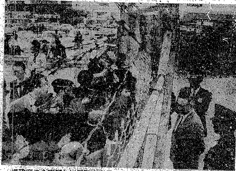
前政府の金網越しに民政官会見の申し入れをする首里高校生たち

「軍事基地撤去を」の「捜査」四度、軍事基地に幾く向けられ、裁判権を「移せよ」との。二十三日午後三時、浦添市の米政府前法務局に抗議行動が起された。