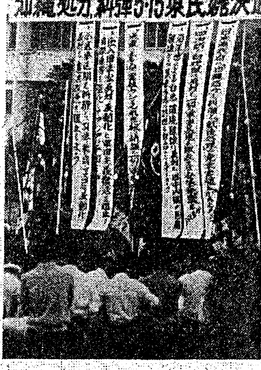
5・15集会に出席した徹徹的労働者学生と復讐修集会