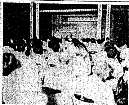
6月10日読谷村中央公民館における結成大会