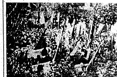
▲ 狭山差別裁判前夜に決起した労働者・人民