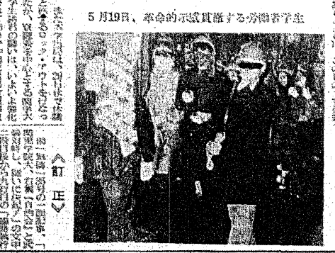
5月19日、革命的な決起を遂げる労働者学生