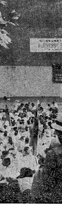
狭山差別裁判糾弾闘争三日 (記事2面・写真)

三里塚の闘争は、労働者、農民、市民の運動を社会主義的・共産主義的・反帝国主義的・反差別主義的・反核戦争的・反公害的・反環境破壊的・反戦争的