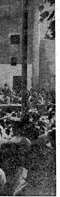
狭山差別裁判糾弾闘争三日 (記事2面・写真)

現在、三里塚において、政府・公団の悪あがきの攻撃が岩山鉄塔に對して集中されようとしている。至るところの土の停止、空港開港への反対闘争に臨んで