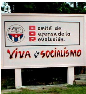
Committees for the Defense of the Revolution (CDR)

Paul Jay : ジェイ: 数年前キューバ国内をレンタカー旅行し、多くヒッチハイカーを乗せたことがあります。よくキューバでは自由な行動はできないと言われますが、そんなことはありませんでした。