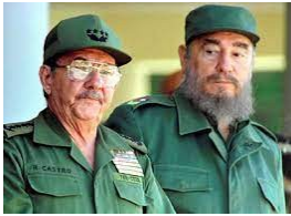
Fidel Castro/Raúl Castro