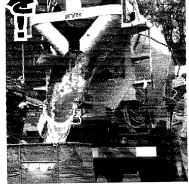
苦境にある生コン輸送労働者の賃下げ・休日大幅削減撤回に反撃を!

（編集部注）2024年12月22日、「オールジャパン労働組合」が、大阪府中央区大阪府立労働センター（エル・おおさか）で結成され、闘う労働組合としてスタートを切った。会場には事前の予想を上回る多くの参加者が集まり、関心の高さがうかがわれた。ここに結成大会の概要を紹介する。詳細は、中小企業組合総合研究所機関紙『提言』2月1日号をご覧ください。