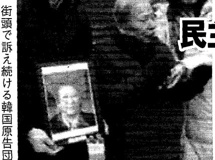
街頭で訴え続ける韓国原告団

韓国原告団 不二越株主総会で訴え 日本の敗戦・韓国の光復から80年を迎えた今年。昨年、韓国大法院は不二越強制労働員を「不法な植民地支配と直結した日本企業の反人道的な不法行為」と断罪したが、尹政権は日本と企業を免罪する「代理弁財」を強行してきた。 しかし今韓国では、連日100万を超える市民たちが