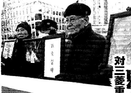
【関連記事】徴用工遺族が勝利！ 対三菱重工への損害賠償請求8300万ウォン認定へ

韓国原告団 不二越株主総会で訴え 日本の敗戦・韓国の光復から80年を迎えた今年。昨年、韓国大法院は不二越強制労働員を「不法な植民地支配と直結した日本企業の反人道的な不法行為」と断罪したが、尹政権は日本と企業を免罪する「代理弁財」を強行してきた。 しかし今韓国では、連日100万を超える市民たちが