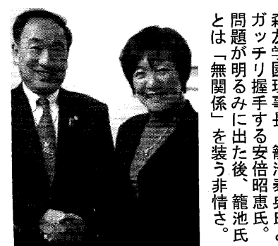
森友学園理事長・籠池泰典氏とガッチリ握手する安倍昭恵氏。問題は明らかに出た後、籠池氏とは「無関係」を装う非情さ。