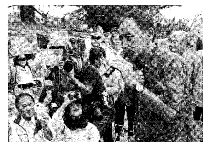
12.4 辺野古ゲート前集会で発言する玉城知事

29日、嘉手納町の沖縄防衛局前広場で抗議集会を行い、防衛局へ抗議文を提出。県の設計変更不承認を受け入れるよう訴えた。 12月3日、再び県民広場前で集会とデモ行進を行い、街宣右翼の妨害に負けず2km先の牧志駅前までデモ行進を遂げた。 12月4日、辺野古米軍ゲート前で「設計変更不承認」を支持・支援する県民集会として800名規模の大集会を開催。集会には玉城知事が就任後、初めて参加。改めて国の埋め立て変更承認申請「不承認」を報告し、「国の横暴に負けてはいけない!」と市民らに結束を呼び掛けた。 集会参加者から「知事の思いを直接聞けて良かった!」これぞまた勢いがつく! など歓迎する声が続々と上がった。