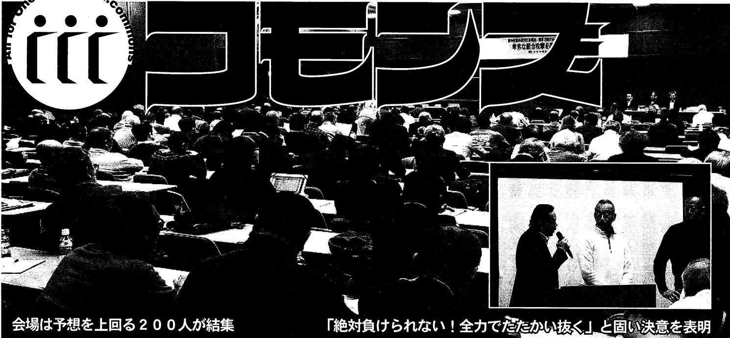
会場は予想を上回る200人が結集

コモンズとは…労働者農民市民が協働して、国家と私を超えた自治と生産の共同の場を、共に作り合うこと