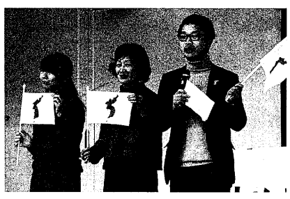
2月24日の集会の様子