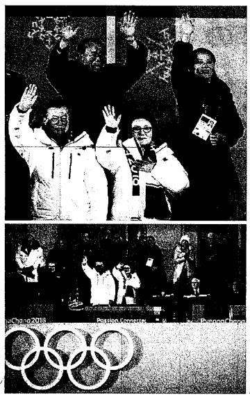
2月24日の集会の様子