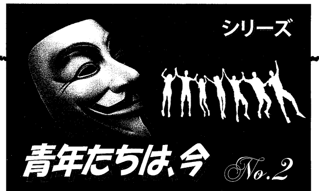
「アノニマス」によって抵抗のシンボルとなったガイ・フォークス面