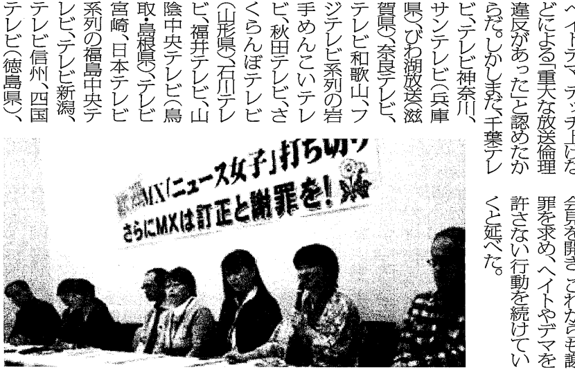
「ニュース女子」打ち切り さらにはCMXは訂正と謝罪を!