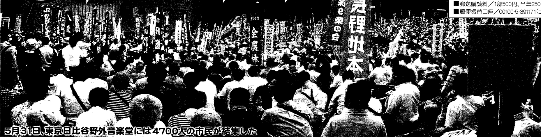
5月31日、東京日比谷野外音楽堂には4700人の市民が結集した