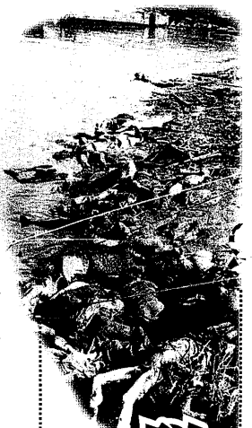
脱植民地化への世界観。 暴力的日常の直視とその非暴力的止揚へ

【25】 政治を仲立ちとした法と企業の連携(『新しいコーポラティズム』と呼ばれる)が発動する新自由主義の暴力性について洞察した書として、ナオミ・クライン [2007] と堤未果 [2013] を挙げておきたい。