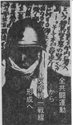
反帝統一戦線 形成へ から

我々の闘争は、単なる学生闘争にとどまらず、労働者階級の闘争と連帯して進めなければならない。我々は、労働者階級の利益を擁護し、労働者階級の闘争を支援する義務を負っている。 我々の闘争は、日共、民青、反革命勢力を粉砕し、社会主義的、革命的な社会を実現するために進めなければならない。我々は、この闘争を通じて、社会主義的、革命的な社会を実現しようとする。