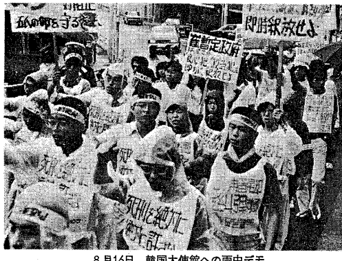
8月16日、韓国大使館への雨中デモ

速報 崔氏再び棄却 去る九月十日、大法院が出された。この相次ぐ司法部の再審請求は、崔氏に有利な結果をもたらした。崔氏は、同日、再審請求を却却された。崔氏に有利な結果をもたらした。崔氏は、同日、再審請求を却却された。崔氏は、同日、再審請求を却却された。