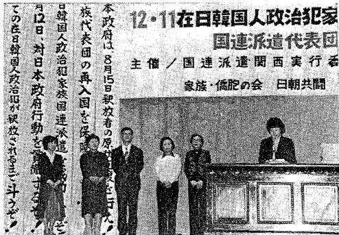
12・11大阪中之島公会堂、国連派遣結団式にて。

日本政府は8月15日解放者の家族代表団の再入国を保障し、日韓両国政治犯家族代表団の再入国許可を交付した。この日韓両国政治犯家族代表団は、12月12日、対日本政府行動を準備する。この日韓両国政治犯家族代表団は、12月12日、対日本政府行動を準備する。