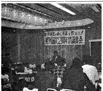
3.15大阪なにわ会館にて